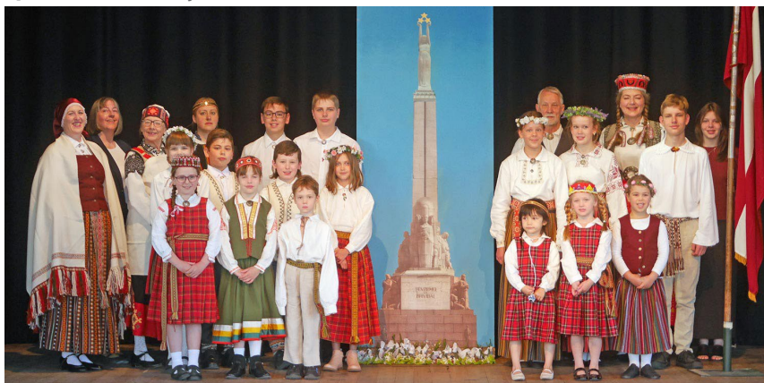
MLB Daugavas skolas saime 2023. gada Valsts svētkos.

No bērniņas dienām Sibīrijā līdz Eiropas parlamentu, Sandra Kalniete ir piedzīvojusi to, kas lielākajai daļai cilvēku prasītu vairākas dzīves. Šī gada svētku runas nosaukums atspoguļo po-