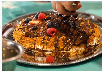
Baibas Grīnbergas meduskūka.